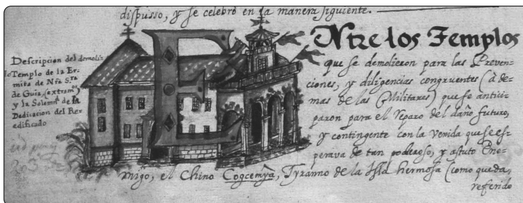
Imagen 2: Anales eclesiásticos de Filipinas , I, fol. 177v (detalle) Dibujo a color de la ermita de Nuestra Señora de Guía