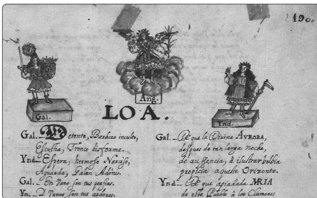
Imagen 3: Anales eclesiásticos de Filipinas I, fol. 190r (detalle) Inicio de la loa

La loa, que ocupa los folios 190-191 del primer volumen de los citados Anales , es de trama sencilla, planteada en clave competencial entre el Galán y el Indio, cuyas posturas acaba armonizando el Ángel Custodio. Consta de 244 versos romanceados, como las anteriores de